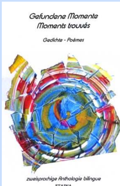
Gesamt-Illustration: Helga Haas, D-Hattingen