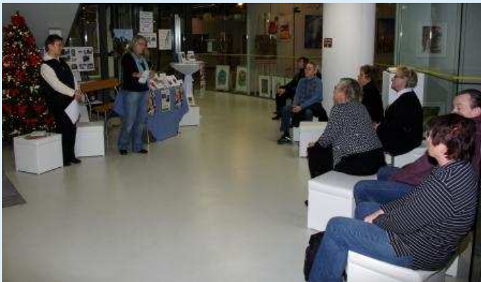
„Werkstatt-Lesung“ – mit Informationen und Beispielen in reizvoller Kulisse