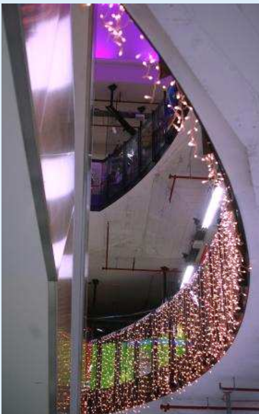
Ungewöhnliche Ein- und Ausblicke in die Architektur des Outlets