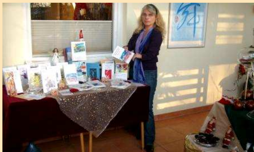
... und deutsch-französische Gedichte