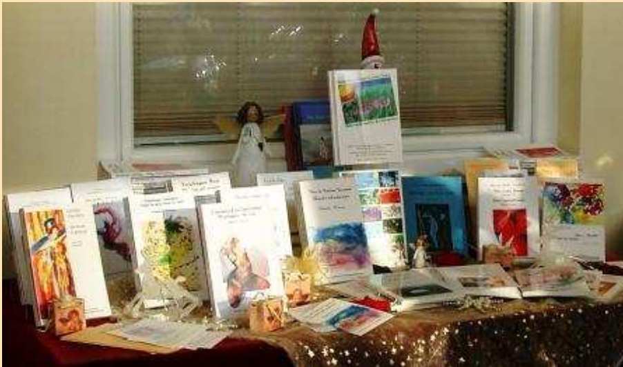
ein reich gedeckter Büchertisch des ETAINA-Verlags