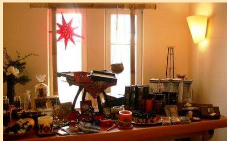
Betörende Düfte, Gewürze, Köstlichkeiten ...