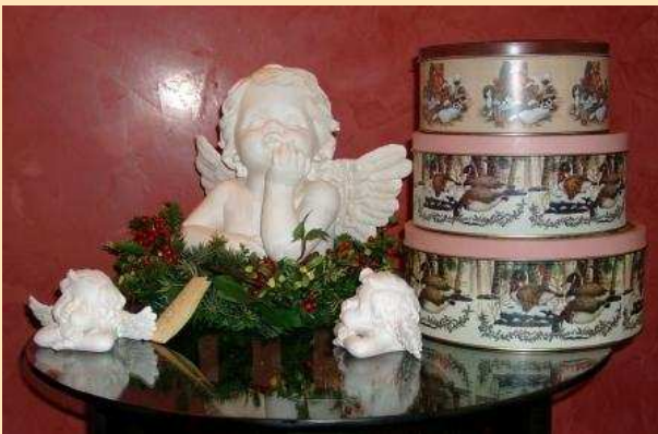
Erlesene Geschenkkideen in besonderem Ambiente